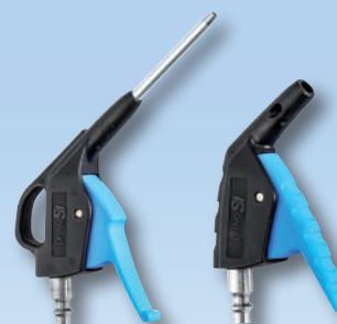
Produits associés : IBG 06MTL – IPG 06OSH