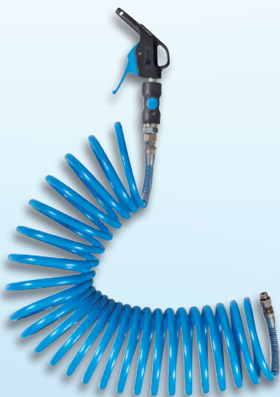
Raccords fixes aux deux extrémités du tuyau spiralé