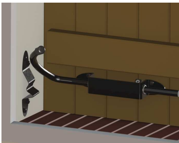
Position canne volet fermé