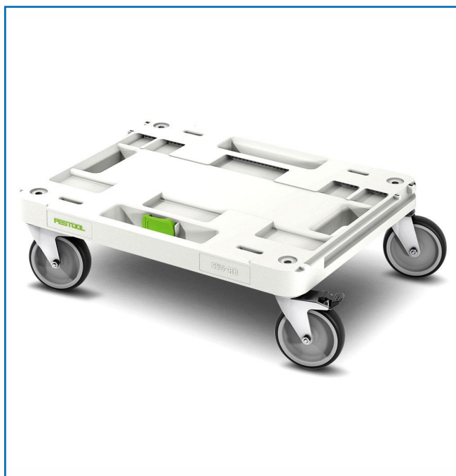
PLANCHE à ROULETTES (ROLLERBOY) SYS-RB