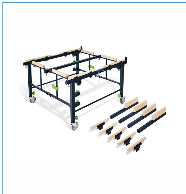
TABLE MOBILE DE SCIAGE ET DE TRAVAIL STM 1800