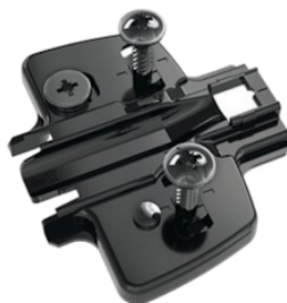
Plaque cruciforme Direkt