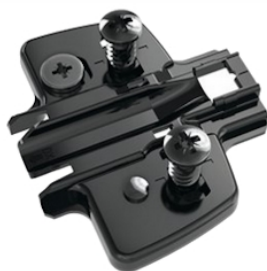
Plaque cruciforme euro