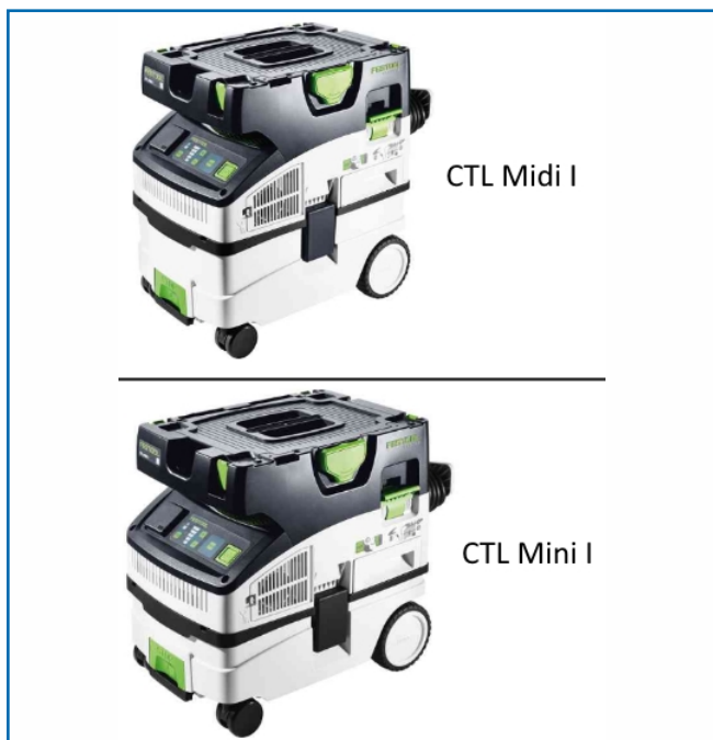
CTL Midi I