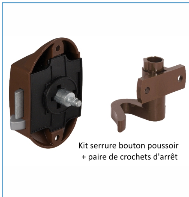
Kit serrure bouton poussoir + paire de crochets d'arrêt