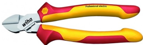
Pince coupante - electric

Longue durée de vie grâce au chromage de la surface de pince qui protège contre la rouille. Articulation spéciale DynamicJoint réduisant la dépense de force lors de la coupe. Pour les fils souples et durs. Modèle Electric : pour les fils à proximité de pièces sous tension jusqu'à 1000 Volt AC. Modèle Classic : tête demi-rondes, style « Suédois » - pour les fils tendres et durs.