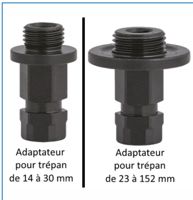
Adaptateur pour trépan de 14 à 30 mm

Coffret disponible avec 3 supports (Hexa 9 et 11 mm et le SDS), 3 adaptateurs (de 14 à 30, de 32 à 152, de 152 à 263), kit universel élargisseur, 3 forets (HSS, COBALT et CARBURE) et une clef 6 pans.