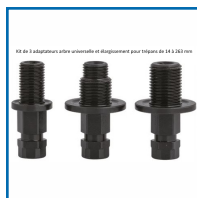
33 de 3 adaptateurs universels et élargisseur pour trépan de 14 à 30 mm