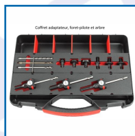
Coffret adaptateur, foret pilote et arbre