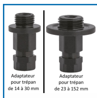
Adaptateur pour trépan de 14 à 30 mm

Coffret disponible avec 3 supports (Hexa 9 et 11 mm et le SDS), 3 adaptateurs (de 14 à 30, de 32 à 152, de 152 à 263), kit universel élargisseur, 3 forets (HSS, COBALT et CARBURE) et une clef 6 pans.