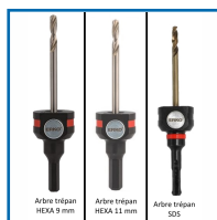
Arbre trépan HEXA 9 mm