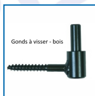
Gonds à visser - bois