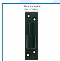
Gond sur platine - bois - 16 mm