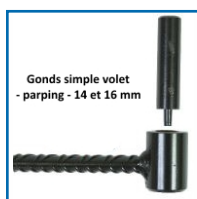
Gonds simple volet - parping - 14 et 16 mm

- Gonds sur platine pour volet simple, idéal pour le bois. Trous fraisés de 7 mm, écart entre la platine et le gonds de 9 mm - Seau de 20 gonds.