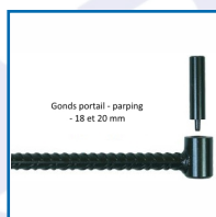
Gonds portail - parping - 18 et 20 mm