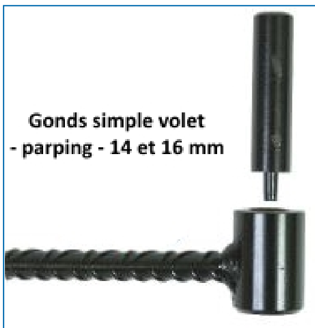
Gonds simple volet - parping - 14 et 16 mm