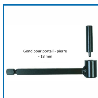
Gond pour portail - pierre - 18 mm