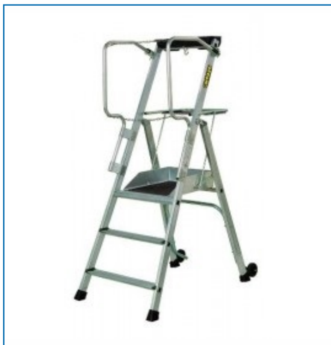
PLATE-FORME ROULANTE PL3 ET PL4