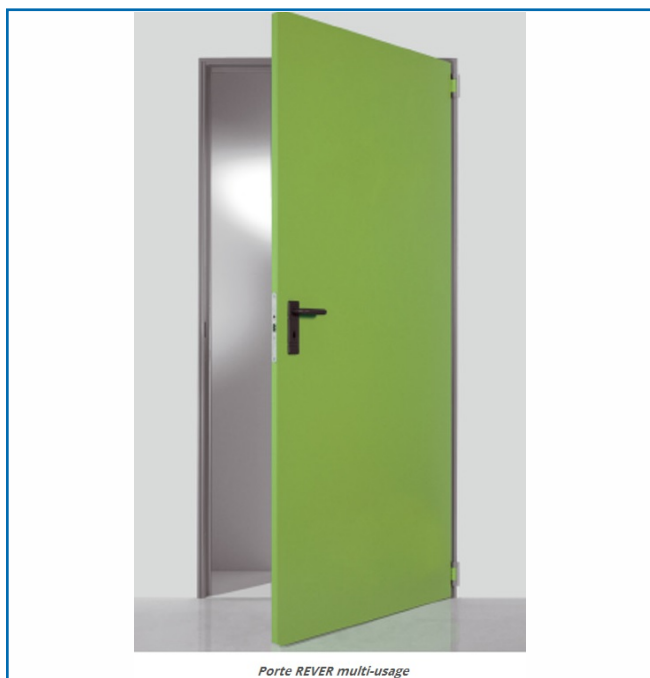
Porte REVER multi-usage