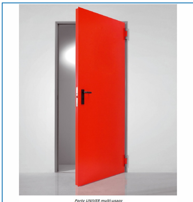
Porte UNIVER multi-usage