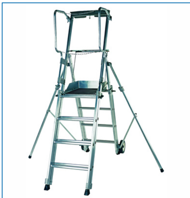
PLATE-FORME DE TRAVAIL TÉLESCOPIQUE PL SCOP